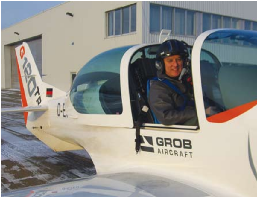
El G120TP retiene la gran cubierta y los asientos side-by-side del G120