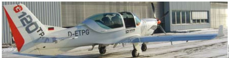
La construcción completa en fibra de carbono dota al aparato de un peso ligero y una resistencia excepcional

cado: es un placer volar este avión y carece de vicios que puedan tomar por sorpresa a un alumno aspirante a piloto. Me maravillé de la potencia y la suavidad de la combinación motor/hélice. Si se necesitaba ganar altura para recuperar el nivel de vuelo horizontal tras una maniobra de entrenamiento, aplicando potencia, se aceleraba sin esfuerzo, como en un jet, recuperando fácilmente la altura.