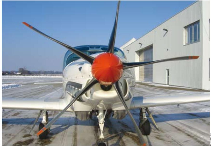
La hélice MT de cinco palas combina adecuadamente con el turbohélice R-R 250 B17F y el fuselaje del G120

Una secuencia rápida de acrobacias aéreas mostró lo que mis pruebas previas habían indi-