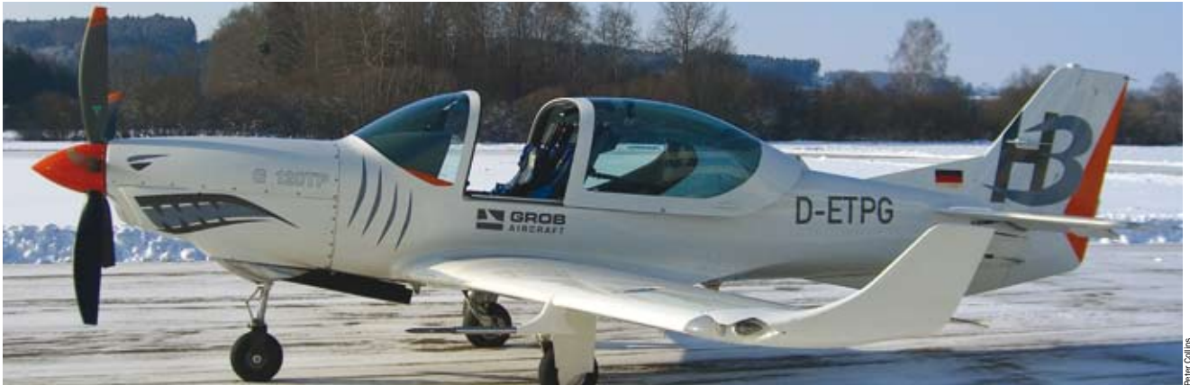
En los próximos dos años, muchos pilotos de pruebas e instructores militares seguirán mis huellas por el corto camino que conduce a Tussenhausen para evaluar el G120TP

» el suelo hasta unos 250-300 m delante del avión sin zonas muertas.