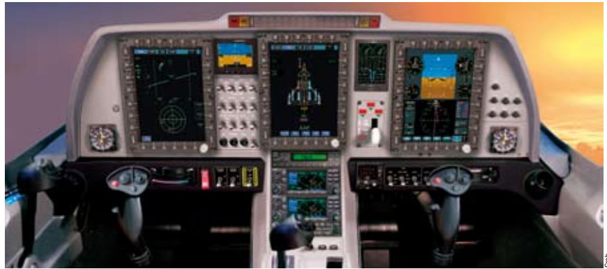
El G120TP estará equipado con una cabina de cristal